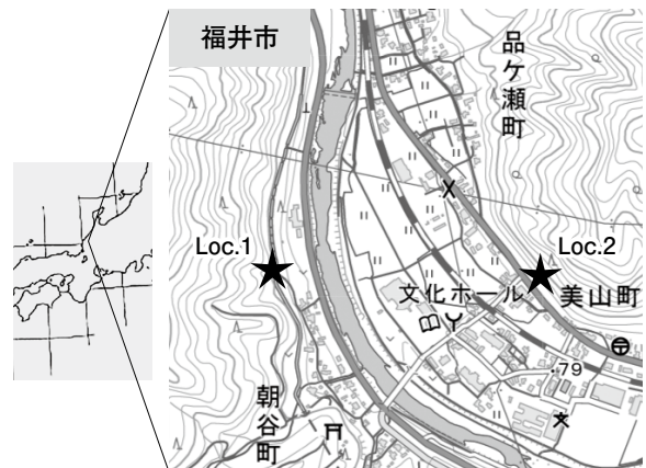
図1. 化石産地図 国土地理院Web版使用

本報告の化石産地を図1に示す。化石は小和清水層(山田ほか, 2008)の2地点(Locs.1, 2)の黒色～灰色の頁岩などから産出した。Loc.1は本層のほぼ中位付近に当たるが、Loc.2はそれより少し上位の層準と見られる。