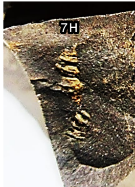
⑧ (FCMNH GF 10099)