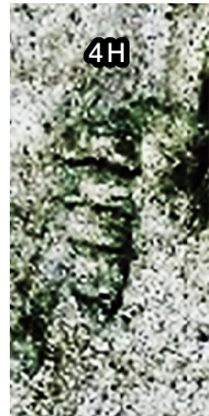
⑩ (FCMNH GF 10101)