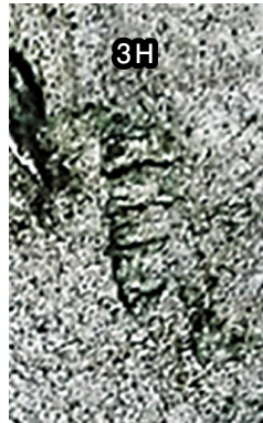
⑨ (FCMNH GF 10100)