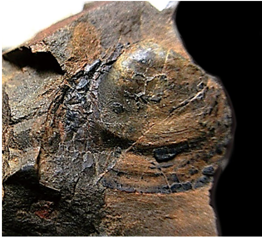
① (FCMNH GF 10097a, 16W)