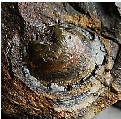
③ (FCMNH GF 10098a, 8W)