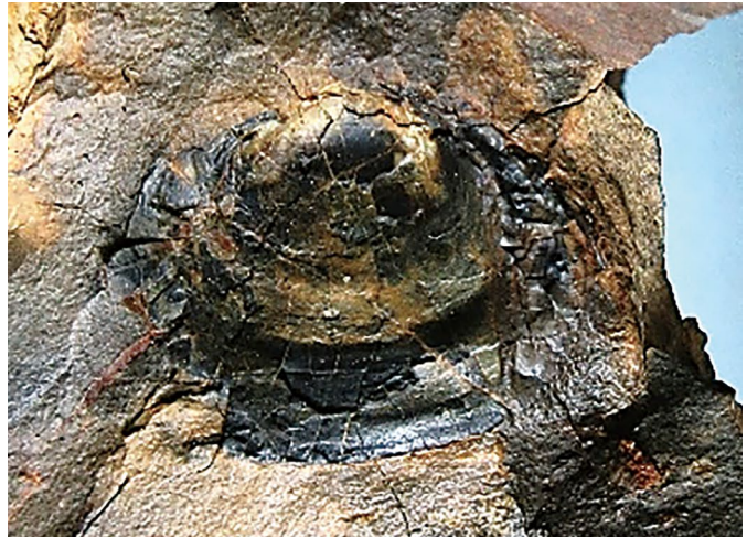
② (FCMNH GF 10097b, 17W)