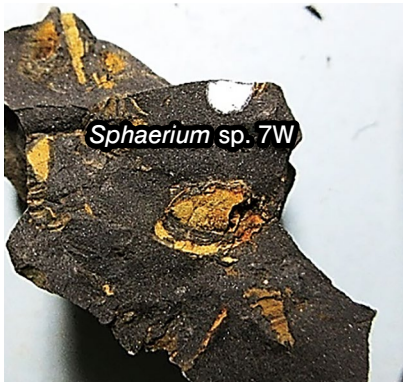
⑦ (FCMNH GF 10099)