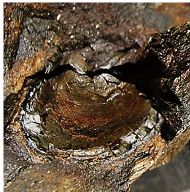
④ (FCMNH GF 10098b)