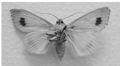
今回採集されたクロモンシタバ Ophiusa tirhaca Cramerのオスの個体

昆虫大図鑑（蝶蛾編），北隆館，東京，284p. 杉 繁郎，1982, ヤガ科, 669-913. 井上 寛・杉 繁郎・黒子 浩・森内 茂・川辺 湛, 日本産蛾類大図鑑（解説編），講談社，東京，966p.