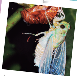
セミの羽化の観察