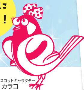
博物館マスコットキャラクター カラコ