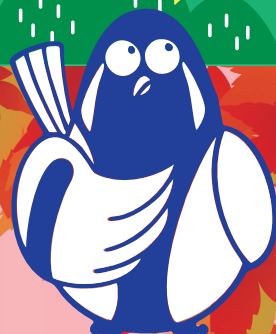
博物館マスコットキャラクター シジュウオ