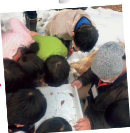
冬越し昆虫の観察会