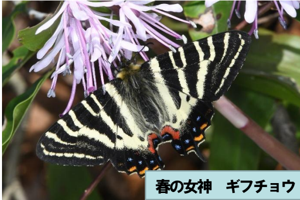
春の女神 ギフチョウ

参加されたことのある方もない方も友の会会員の方ならどなたでもご参加いただけます。