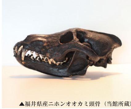
▲福井県産ニホンオオカミ頭骨（当館所蔵）