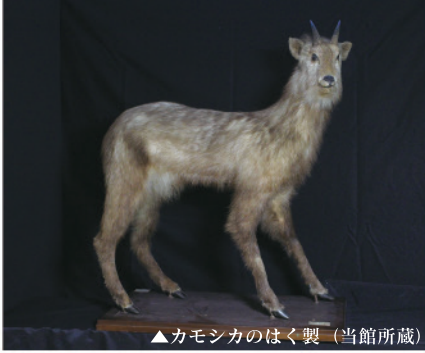
▲カモシカのはく製（当館所蔵）