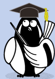
福井市自然史博物館 キャラクター シシユウ