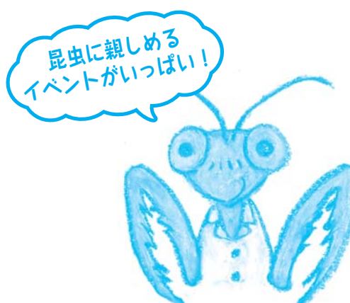
イラスト：伊藤 尚子 氏作