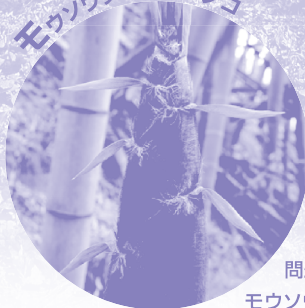
モウソウチクのタケノコ

近年、繁茂が問題となっているモウソウチクは、地下茎から発生するタケノコによって増えます。5月上旬頃から地上に次々と現れるタケノコは、約3か月間で著しい成長を遂げ成竹になります。