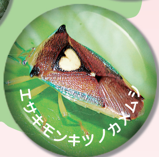
トサキモンキツノカメムシ