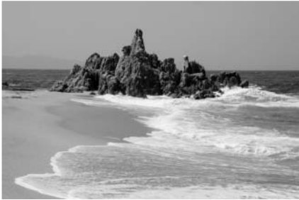
敦賀半島水晶浜（三方郡美浜町）