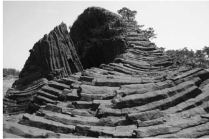
越前松島（三国町梶）