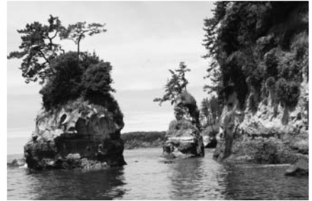
東尋坊福良の浜（三国町安島）