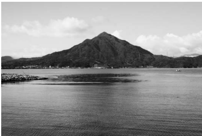
青葉山（大飯郡高浜町）