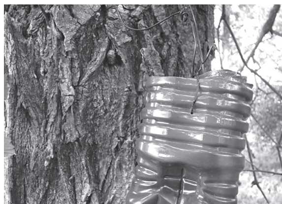
Fig. 1：河川敷に設置したノムラホイホイ。

アカマダラハナムグリの幼虫や蛹は鳥類の巣から発見されてきた (e. g., 榎原ら, 2004)。このことから、