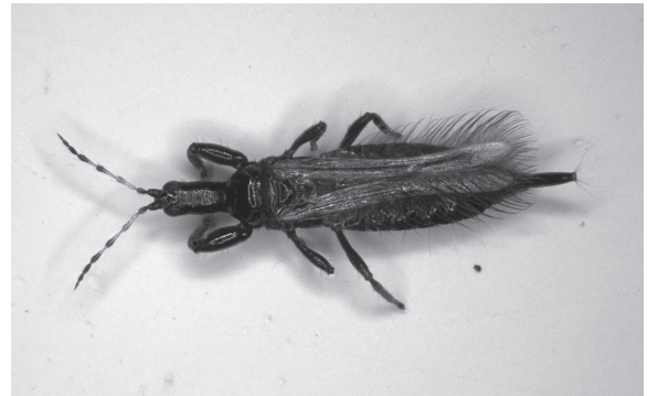
図2. Ethirothrips antennalis 雌