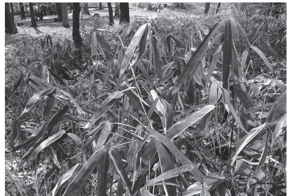
図1. 棲息環境のクマザサ群落

本報によって福井県産オオアザミウマ亜科 (Idolothripinae) は柴田 (2015, 2016, 2017) の計9種に1種追加され計10種となった。