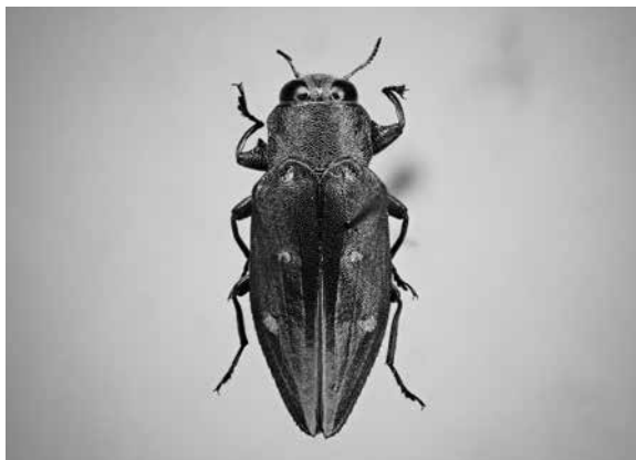
図1：オオムツボシタマムシ

筆者の勤務先である福井県立鯖江青年の家 (鯖江市上野田町19-1) の敷地内において採集した。鯖江青年の家では、2014年12月に敷地の斜面が一部崩壊し、その復旧工事に合わせて、クヌギやシラカシ、コナラ、アベマキ等の雑木の伐採が継続的に行われている。伐採された材木の一部を、小屋内に保管しており、その