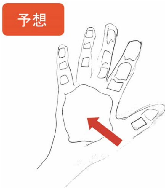
図10：参加者の立てた一般的な予想 指の数は正確だが、動かすことのできない手の甲は予想することが難しかった

その後、私たちヒトの手には何本の骨があるか？という疑問をなげかけた。推測の過程では特に標本を用いず、参加者自身の手を観察対象とした。参加者は指関節を曲げたり伸ばしたり触ったりしながら骨を数えている(図9)。このように自分の手をじっくりと観察することによって、指骨数の推測は非常に正確であった。一方で、動かすことが難しい手の甲の部分は推測するのも難しく、図10のように一枚板状の骨になっていると推測する参加者が多かった。ただし、予想が正しいかどうかではなく、予想を導き出す過程における工夫がどのように施されたかという点が、教育普及プログラムの参加者にとって重要な点であると思われる。 確認： 次に展示されているヒトの前肢の模型標本と参加者のスケッチとの比較を行った。予想と比べ、