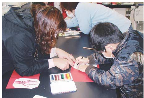
図13：工作は保護者と一緒になって進めることが多かった