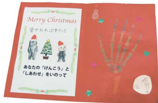
図12：完成したホネクリスマスカード