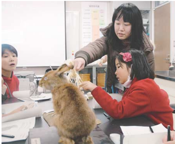
図2：博物館実習生による解説