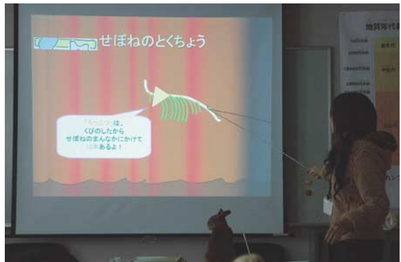
図6：博物館実習生による骨の基本構造についてのプレゼン