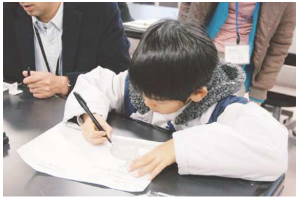
図4：予想は配布されたプリントにマジックで書き込んでいく