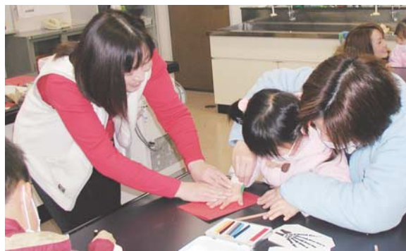
図14：当該プログラムに運営側として参加した博物館ボランティア

福井市自然史博物館においては、教育普及プログラム「博物館うらがわツアー」の実施を通して、博物館ボランティアが展示解説を行う意義は大きく二つあることが確認されている(田中, 2009)。一つは「学芸員と比べ博物館ボランティアは来館者に身近な存在である」といった来館者に対する意義である。もう一つは「満足感」や「自信」につながるといった解説を行うボランティア自身にもあることである。そのため本稿で紹介した教育普及プログラムは博物館ボランティア・骨部および福井大学の博物館実習生の協力を積極的に呼びかけた(図14)。その結果、市民連携の一つ目の意義である学芸員と参加者の橋渡し役としても活躍し、参加者のアンケートからも好印象を与えたことが確認できた。