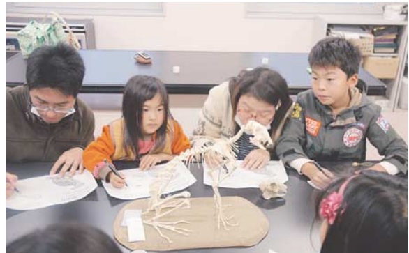
図7：ウサギの骨をスケッチする参加者