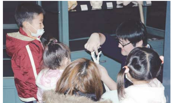
図11：ヒトの手の骨の数を全員で数える

その後、私たちヒトの手には何本の骨があるか？という疑問をなげかけた。推測の過程では特に標本を用いず、参加者自身の手を観察対象とした。参加者は指関節を曲げたり伸ばしたり触ったりしながら骨を数えている(図9)。このように自分の手をじっくりと観察することによって、指骨数の推測は非常に正確であった。一方で、動かすことが難しい手の甲の部分は推測するのも難しく、図10のように一枚板状の骨になっていると推測する参加者が多かった。ただし、予想が正しいかどうかではなく、予想を導き出す過程における工夫がどのように施されたかという点が、教育普及プログラムの参加者にとって重要な点であると思われる。 確認： 次に展示されているヒトの前肢の模型標本と参加者のスケッチとの比較を行った。予想と比べ、