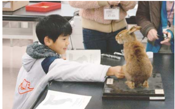
図3：ウサギの剥製を観察し、内部の予想を立てる