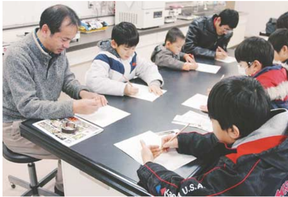
図9：自分自身の手を観察し、手の骨がどのようになっているか予想を立てる参加者

観察と予想： まず、博物館ボランティアと学芸員とで小劇を演じ、手の形態の多様性に触れた。その際、アナグマ、ブタ、ウマの骨格標本を用いた。特に、指の数がそれぞれの分類群によって異なっていることを強調した。