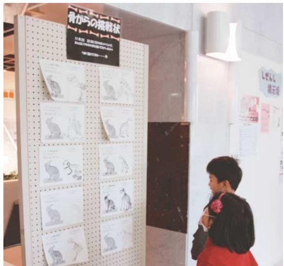
図8：博物館玄関にてスケッチを掲載した

まず、剥製だけを観察し予想を立て(上)、次いで骨格標本を観察した(下)。耳は軟骨である等、骨格標本の観察を通して参加者が立てた予想との違いを確認することができる。