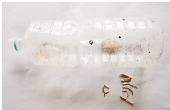
図1：拾得したペットボトル。中にジャノメガザミの死体が入っている。下は拾得後に外れた右鉗脚と歩脚。

ジャノメガザミは日本では秋田県及び房総半島以南の沿岸各地に分布し、世界的にはハワイからオーストラリア、アフリカ東岸のインド-太平洋域に広く分布する(酒井, 1976; 三宅, 1983)。稚ガニは流れ藻に付着することが知られており、その甲幅サイズは日本海