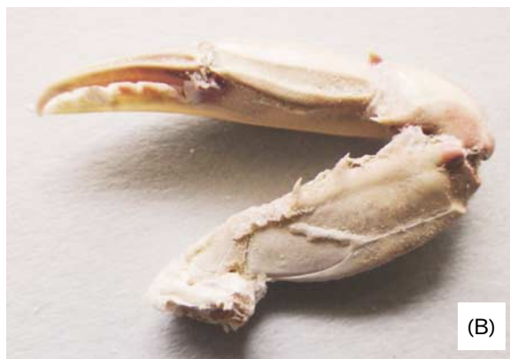
図2：(A)ペットボトル内のジャノメガザミ(ボトルの外から撮影)。矢印が識別点となる斑紋。(B)右鉗脚。