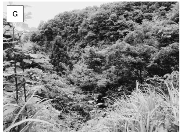
図2：各調査地点の環境写真