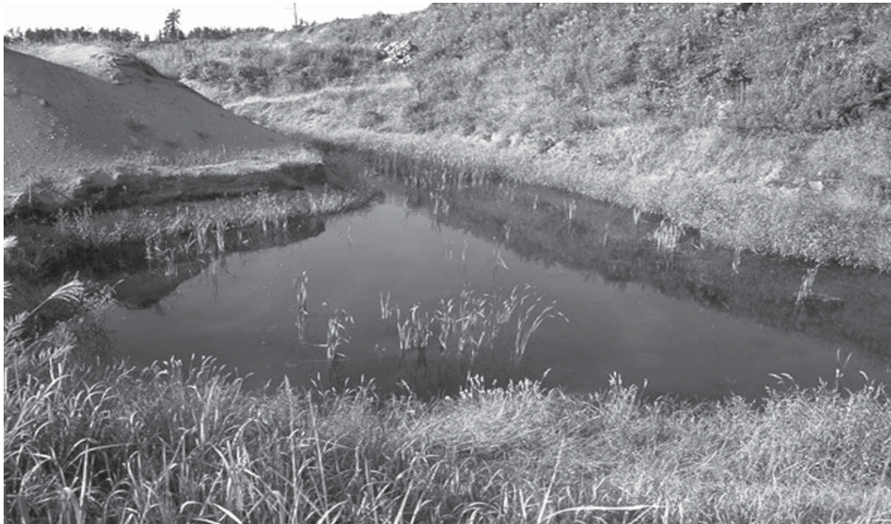
図3：ミズアオイが確認された池 2003年9月26日 福井市西二ツ屋町