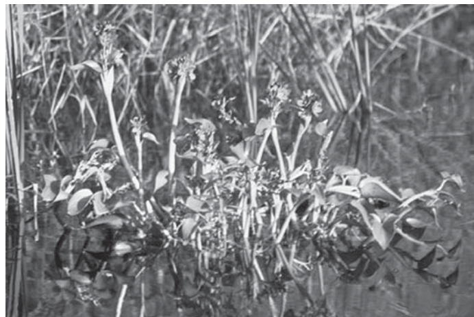
図1：ミズアオイ2003年9月26日 福井市西二ツ屋町