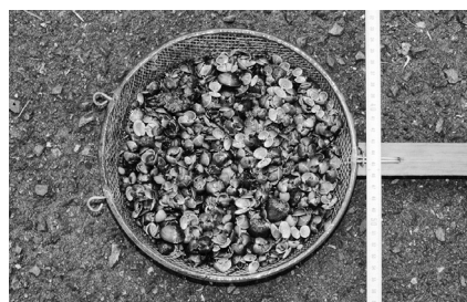
図2 芝原用水からすくい上げたタイワンシジミ