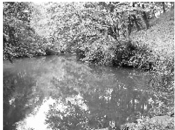
写真2 福井市上一光町の池

上一光町に生息するワタカが移入魚であることは疑いの余地がないが、いかなる理由で、山中にある池に放流されたのか。この池の周辺には、現在は無人と思われる別荘らしき建物があった。また、捕獲当時は、池の近くに「別荘分譲中」なる看板が設置されていたが、この時点で営業活動していたとは到底考えられず、看板は単に放置されていたであろう。となれば、導き出される推測は、これらの住宅の関係者の何者かが意図的に、何年か前に放流したということにしか行き着かない。なお、この池には、ブラックバスやブルーギルは生息していないようである。だとすれば、釣り目的で放流したブラックバスやブルーギルの稚魚にワタカが混じって定着した可能性は低そうだ。前者1つないしは2つの稚魚に混入する程度の数では、定着するとは思えず、またブラックバスやブルーギルと共に放流されて、ワタカのみが生き残ることも考えにくいからだ。ちなみに、ワタカはフィッシング対象としてはお世辞にもメジャーとは言えない。だとすれば、通