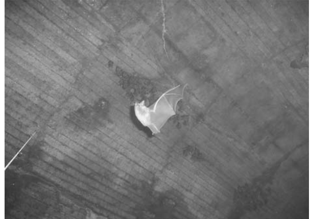
写真1 キクガシラコウモリ(勝山市)

るが、数十個体を記録した銚島洞窟は海岸に位置する。また1個体だけの記録ながら、市街地に近い足羽山廃坑Aでも生息が確認されているので、適当な洞窟がある県内全域に分布していると考えられる。また、他の洞穴性コウモリと異なり、キクガシラコウモリの特徴は、柵古墳や村国山廃屋のように、洞窟とは全くかけ離れた環境でも、姿を見かける点にある。