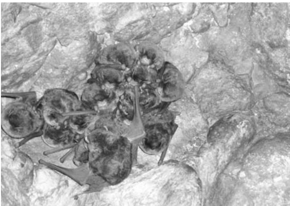
写真3 ユビナガコウモリ(越前町)

ユビナガコウモリ(写真3)は、県域準絶滅危惧種に指定されている。今回の調査で本種を確認したのは、旧下荒井トンネル、呼鳥門A、呼鳥門B、村国山トンネル、下長谷Bの5ヶ所で、決して多い数字ではない。呼鳥門Aは11月の調査時に20頭近くを確認したが、年明けの調査では完全に姿を消していたので、恒常的に利用しているかどうかは極めて疑わしい。そもそも呼鳥門Aは、入り口が広くて、最奥部までの距離も決して長くなく、集団での繁殖に適しているとは思えない。