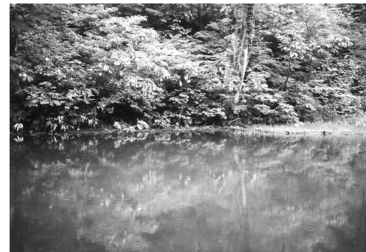
夫婦池 (大きい方の池)