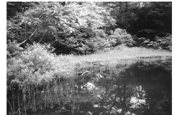
夫婦池 (小さい方の池)