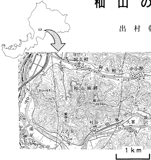
図1 調査位置 (国土地理院発行5万分の1地形図「今庄」を使用)

「柚山」は福井県の南条町と今庄町にまたがる標高492.1mの山である(図1)。北方には日野山(794.8m)があり、西方には国道365号線と日野川が平行して走っている。古くから山城として利用され、堀切跡・御殿跡など山全体に当時の史跡が残っている。